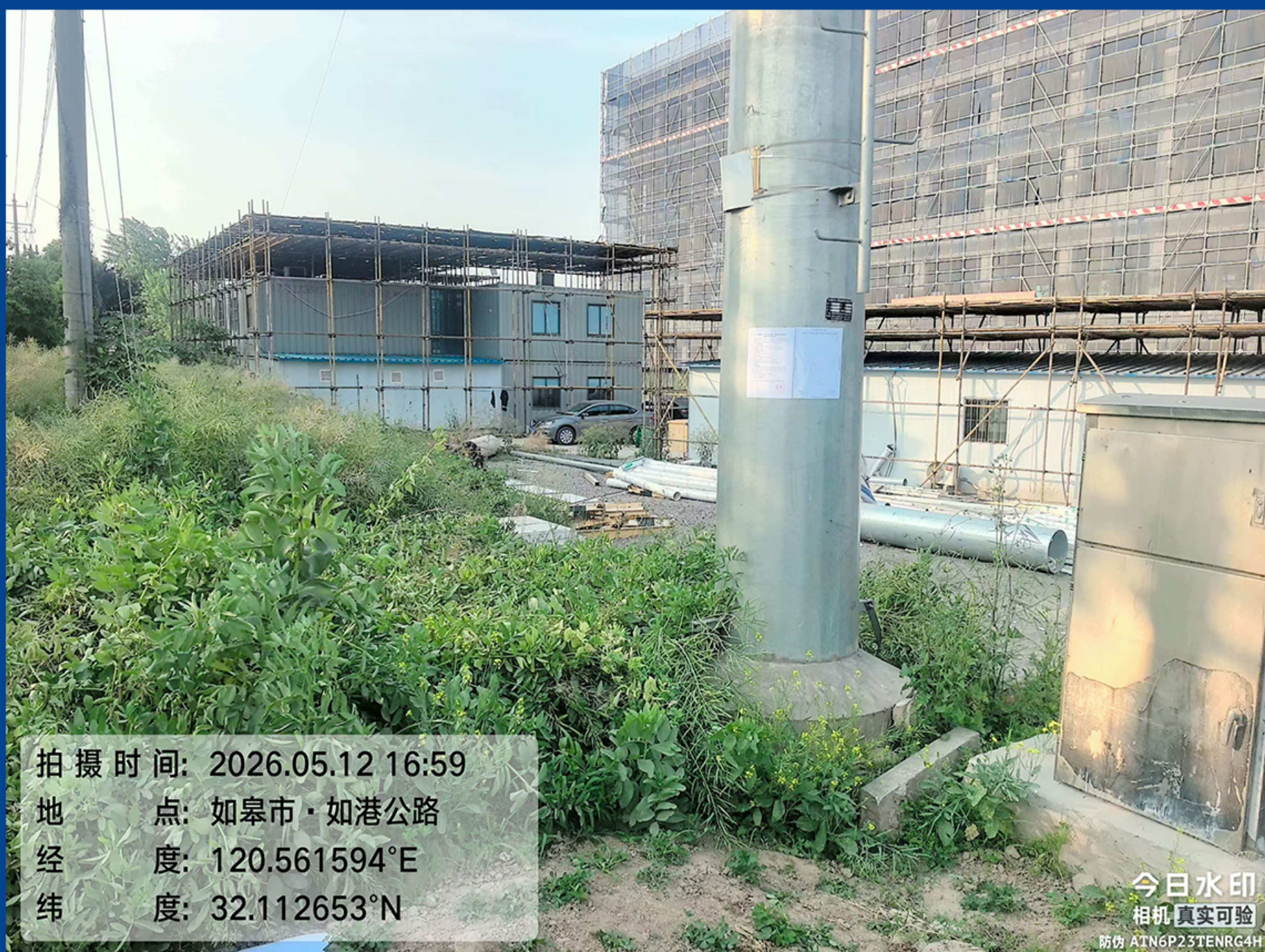
拍摄时间: 2026.05.12 16:59 地点: 如皋市·如港公路 经度: 120.561594°E 纬度: 32.112653°N