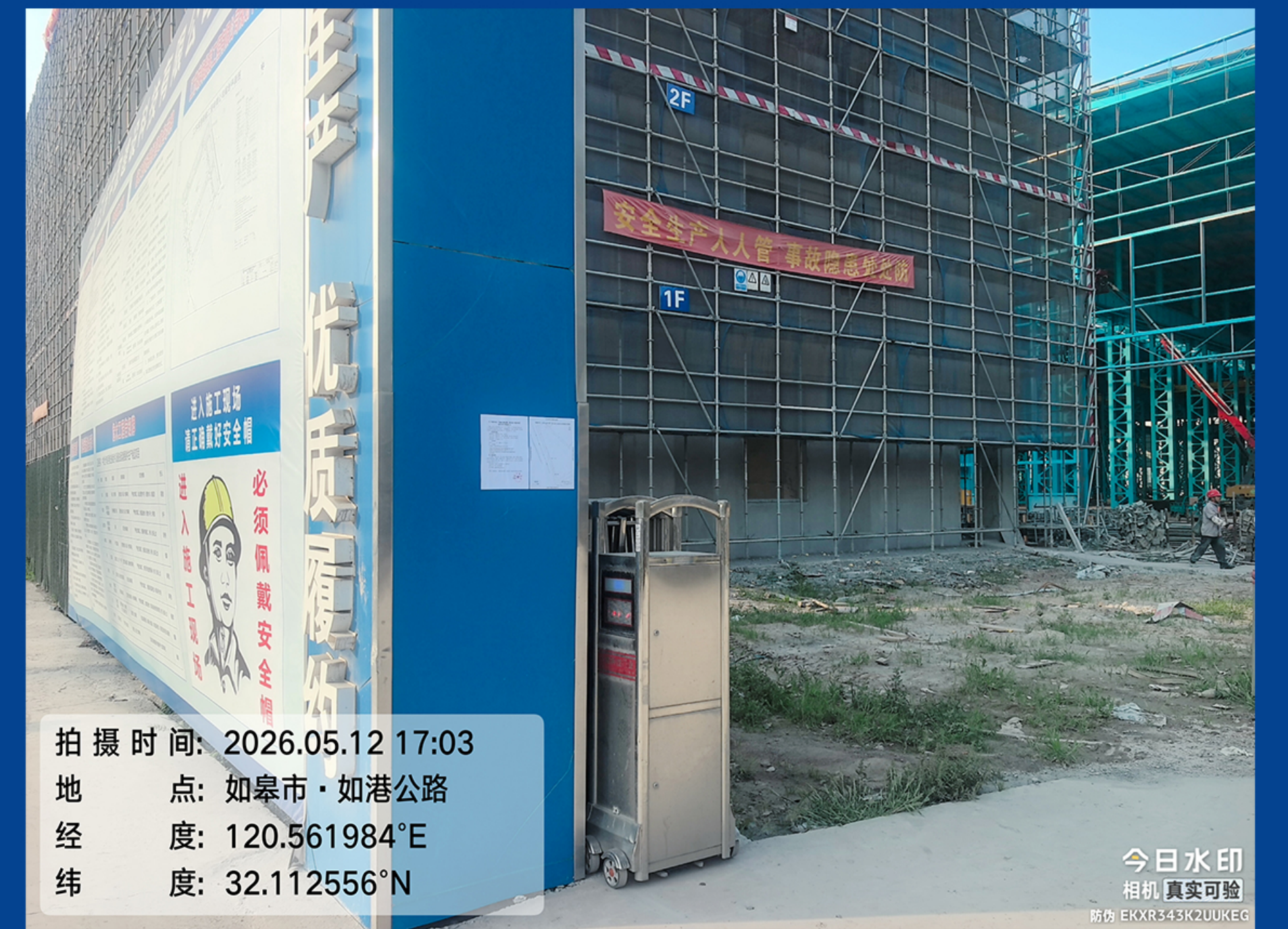
拍摄时间: 2026.05.12 17:03 地点: 如皋市·如港公路 经度: 120.561984°E 纬度: 32.112556°N