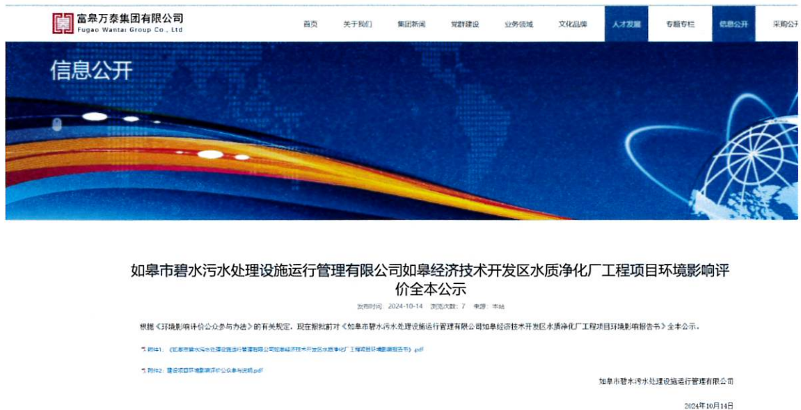
图 4.2-1 本项目全本公示网络截图

2024年10月14日，环境影响报告书报批稿在富皋万泰集团有限公司网站（ https://www.fgwjt.com/ ）上进行了公示，并附上环境影响报告书全本及公众参与说明作为附件。公示截图见图4.2-1。网络公示期间未收到公众反馈意见。