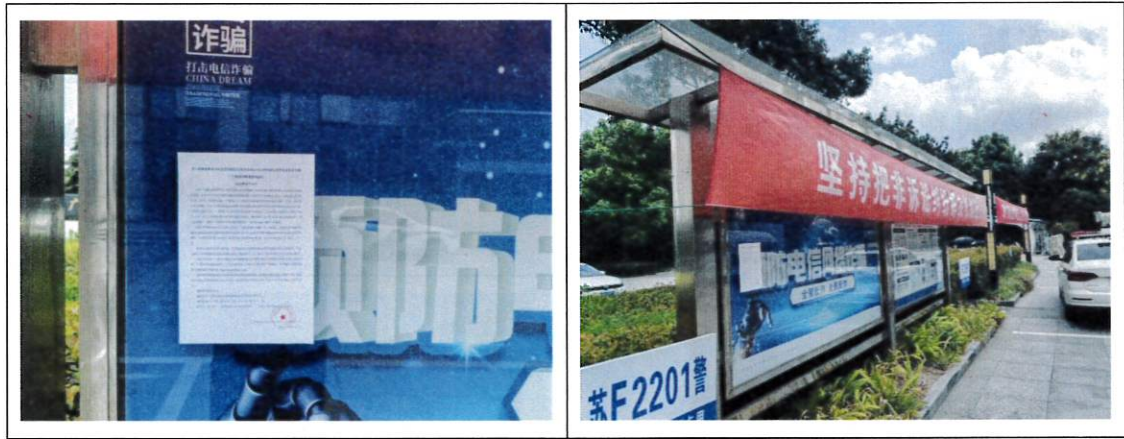
3.2-4 现场张贴公告照片